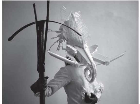
Deity of Fog - 2017 - 120 x 93 cm - impression uv sur Dibond - édition 5 + 2